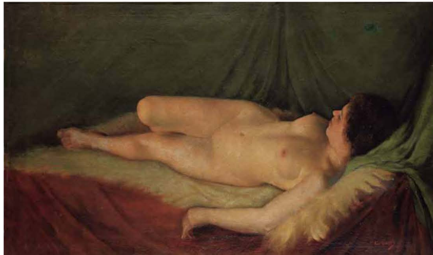
Desnudo , 1898 Óleo sobre tela, 72 x 120 cm

También alquila un importante departamento en París donde se reunía con toda la bohemia de la Ciudad Luz. Era una lujosa mansión que constaba de dos plantas donde realizó una memorable exposición en 1914.