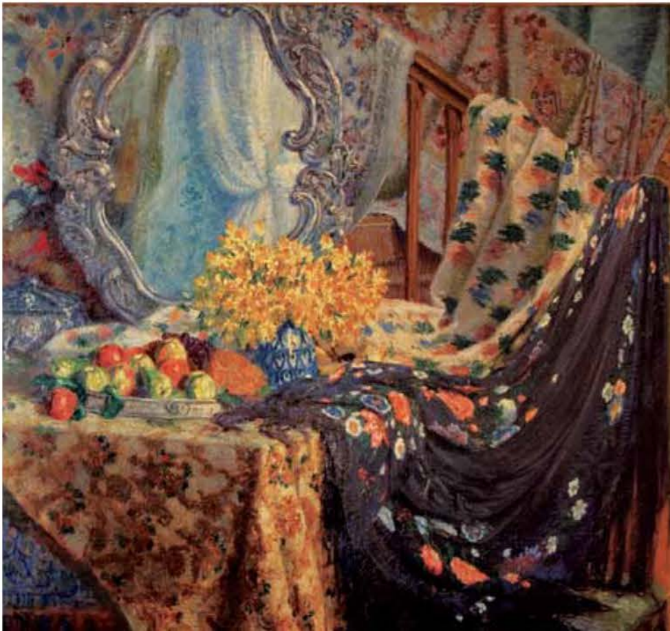
Paños, flores y frutos, 1914 Óleo sobre tela, 162 x 172 cm

Tomó contacto profundo con los campesinos y sus costumbres y comenzó a pintar su magnífica Serie de "Los Gauchos". En ella se imponen la grandiosidad del paisaje local, las fuerzas de las tradiciones pueblerinas y campesinas y el vigor de los personajes criollos.