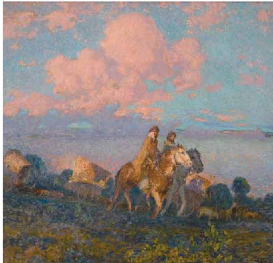
Cabalgando al amanecer, s. f. Óleo sobre tabla, 96 x 98 cm

costumbristas y enriquece su paleta con una variada gama de rojos y dorados. Las fincas rurales del Canadá francés sirvieron de inspiración a Cesáreo para componer obras en las que se adentró en un postimpresionismo con hondas raíces en la naturaleza. A fines de ese mismo año volvió a los Estados Unidos instalándose en Westport.