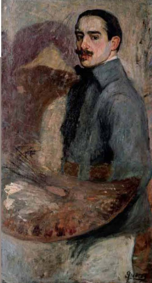
Autorretrato , s. f. Óleo sobre tela, 122 x 66 cm

Viajero incansable durante ocho años recorrió Europa, Canadá y Estados Unidos presentando su serie de "Los Gauchos" y obteniendo numerosas distinciones. También en la Argentina los salones nacionales y provinciales, las galerías de arte y el público lo contaban entre los preferidos. En 1937 se instaló en una vieja casona de la ciudad de Paraná, frente al río, de donde también pintó paisajes. Finalmente eligió comprar una casa en Vicente López, provincia de Buenos Aires donde vivió con su familia desde 1950 hasta el 29 de mayo de 1968, fecha de su fallecimiento. ■