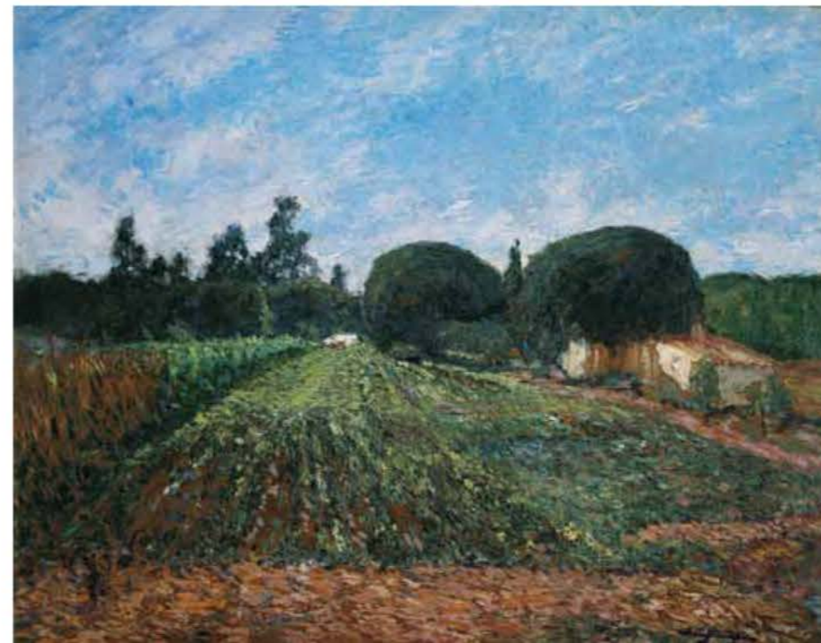
Quinta Ciarlo, Mar del Plata (La chacra), 1960 Óleo sobre madera, 60 x 75 cm

A fines de la década del 40, Quirós se muda a Vicente López, Provincia de Buenos Aires. Allí siguió pintando hasta su muerte, motivos camperos que atesoraba en su memoria, naturalezas muertas y escenas de interiores, utilizando los objetos con que estaba rodeado, como las viejas tallas españolas que había canjeado a un anticuario y que sirvieron de composición para Viejas Imágenes , que fue pintada a los 76 años de vida. ■